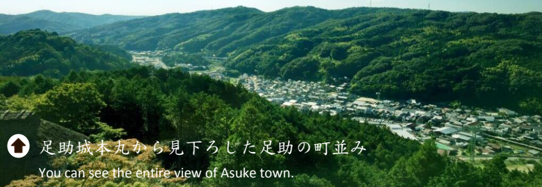
↑ 足助城本丸から見下ろした足助の町並み You can see the entire view of Asuke town.

You can see various kind of mountain plants on the way (the flowering season is different each plants). Those natural botanical garden provided by voluntary local people from Shinno-cho area who loves plant. It's uphill route so, better to take sports shoes and insecticide with you. ※Please do not touch natural plants.