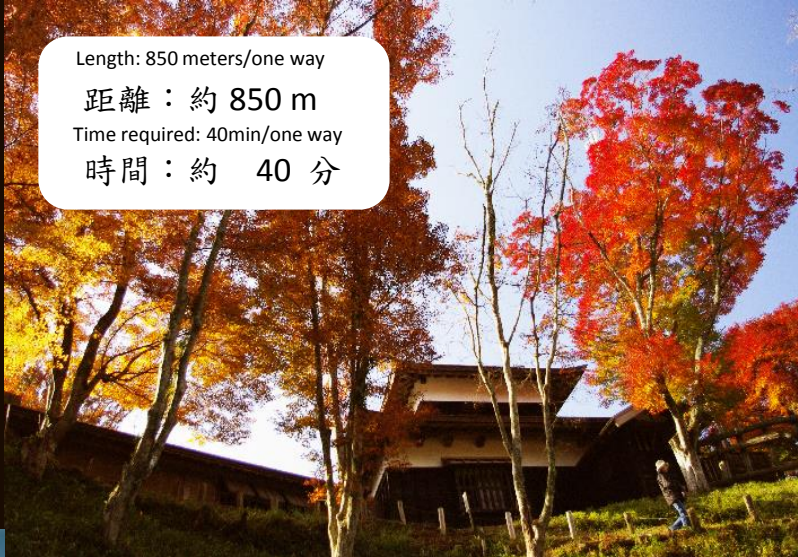
↑ 足助城の秋 Autumn season

Length: 850 meters/one way 距離：約 850 m Time required: 40min/one way 時間：約 40 分