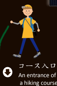
↓ コース入口 An entrance of a hiking course