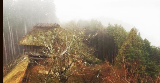
↑ 雨上がりの雲海に包まれた風景や、秋の紅葉で染まった様子なども人気があり、通年を通して多くの方が訪れています。