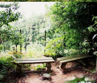
↑ 足助植物園内（コース内）の様子 The greenery heal you.